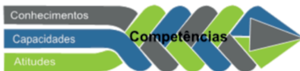
Figura 2 – Esquema conceitual de competência, do projeto 2030 da OCDE (adaptado).

As competências são combinações complexas de conhecimentos, capacidades e atitudes, são centrais no perfil dos alunos, na escolaridade obrigatória. A Figura 2 ilustra este conceito salientando a interligação das três dimensões.