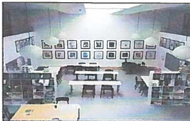
Foto da sala de estudo da ESAD